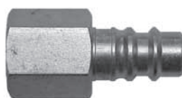
Locking groove (-LG)

Имеются два вида Европейских взаимозаменяемых ниппелей: стандартные (no suffix) и Locking groove (-LG suffix). Оба вида подходят для стандартных взаимозаменяемых Европейских соединений, однако ниппели Locking groove подходят и для соединений Rectus «25KS»