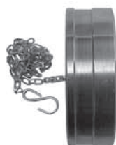
ST-серия защитный колпачок, совместим с серией '71' (жёсткий колпачок от пыли для соединения)