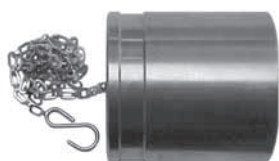
ST-серия защитный колпачок, совместим с серией '71' (жёсткий колпачок от пыли для соединения)