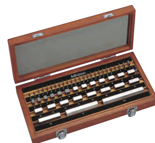
Набор к.м.д. из 47 шт.