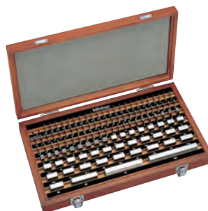
Набор к.м.д. из 103 шт.