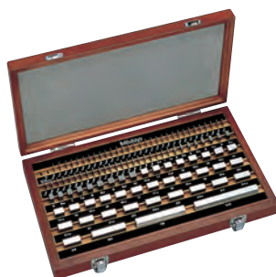
Набор к.м.д. из 112 шт.